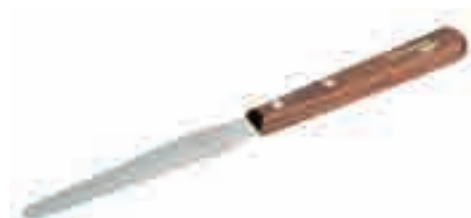
Шпатель для силиконов