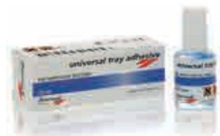
Universal Tray Adhesive