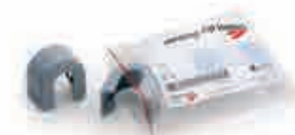
Блокираторы смесительных наконечников

*ПРИМЕЧАНИЕ: отдельные виды смесительных наконечников могут быть недоступны в некоторых странах.