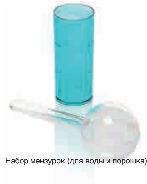
Набор мензурок (для воды и порошка)