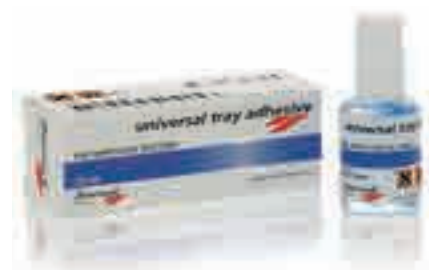
Universal Tray Adhesive