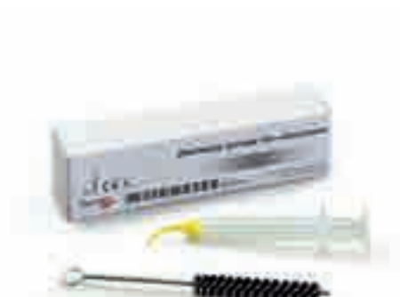
Шприц Zhermack для эластомеров