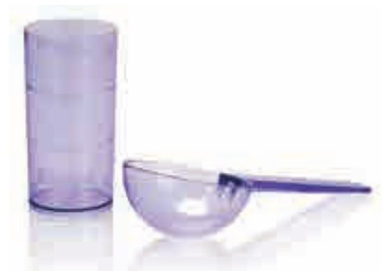
Набор мензурок (для воды и порошка) для hydrogum 5 и hydrocolor 5