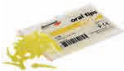
Интраоральные канюли, желтые