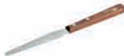
Шпатель для силиконов