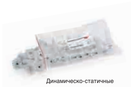
Динамическо-статичные смесительные наконечники