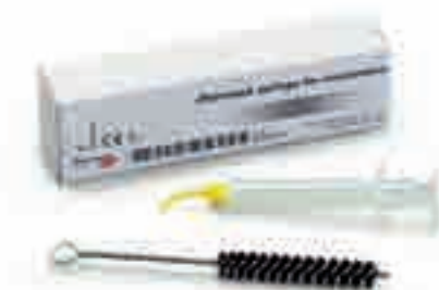
Шприц Zhermack для эластомеров