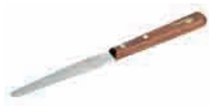
Шпатель для силиконов