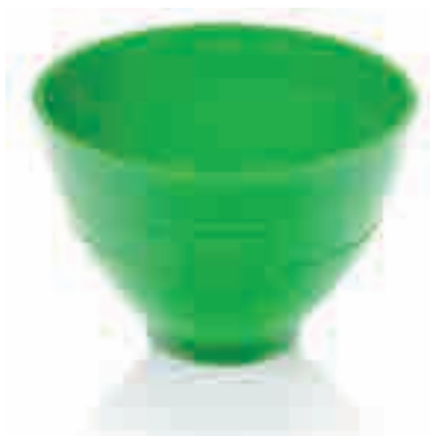
Резиновая чашка для замешивания