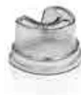
Прозрачная кювета для дублирования