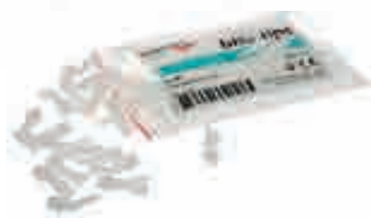
Канюли Bite Tips