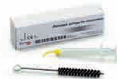
Шприц Zhermack для эластомеров